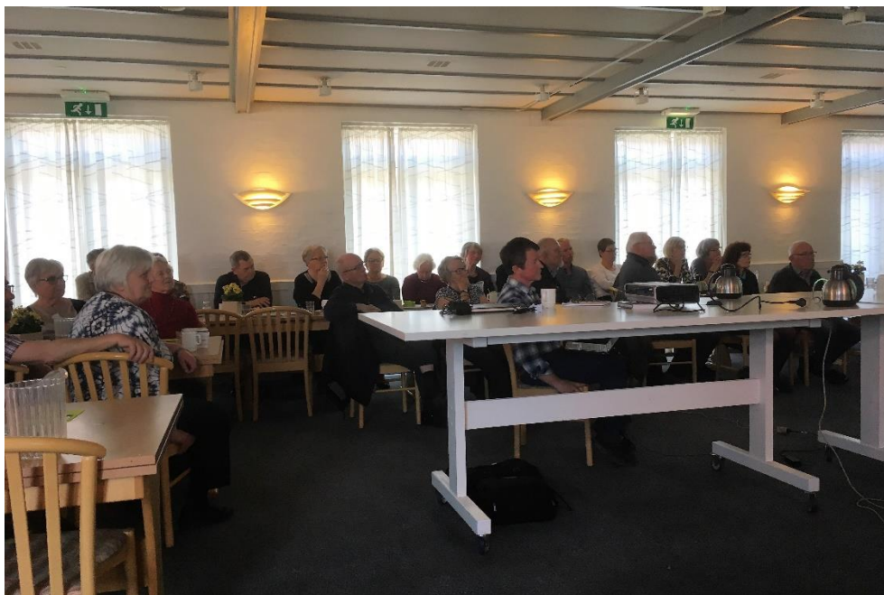
Der ses på billeder af Snaptun by.