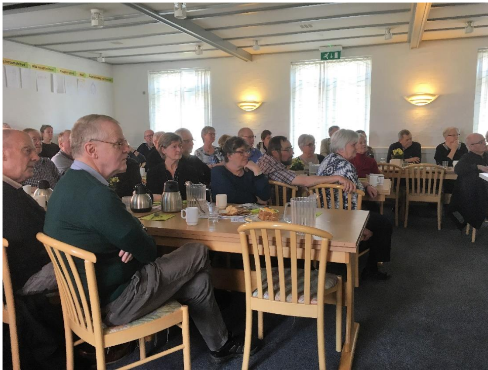
Efter et dejligt måltid varm mad nydes kaffen og der lyttes til Snaptuns historie.