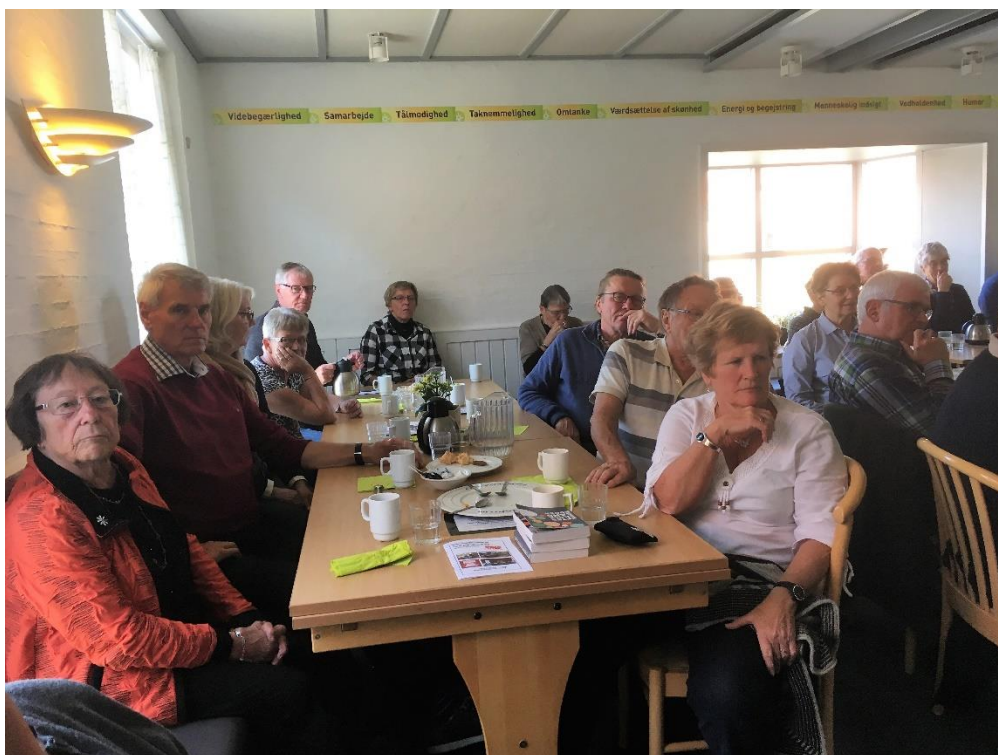
Historien om "postbuddet" fra Horsens blev der lyttet til.