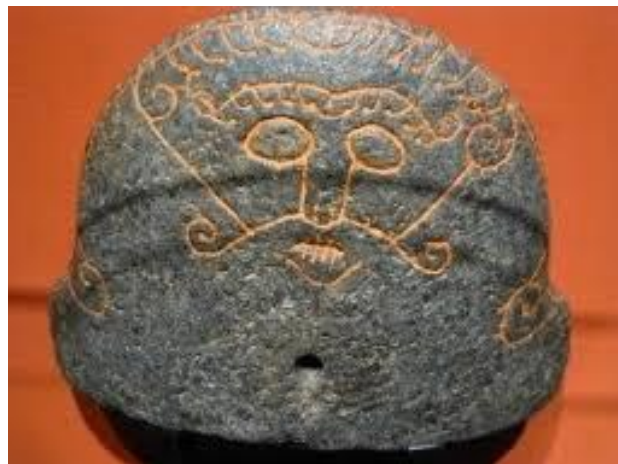
Original blæsebælgsten fundet i Snaptun