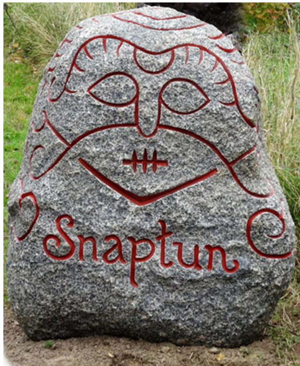
Kopi af blæsebælgsten